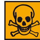
T - Toxique

L'étiquette porte aussi un pictogramme qui indique la dangerosité du produit.