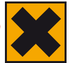
Xn - Nocif

Il existe par ailleurs d'autres phrases qui attirent l'attention sur des risques particulièrement sérieux pouvant influencer le bon déroulement de la grossesse et la croissance de l'enfant :